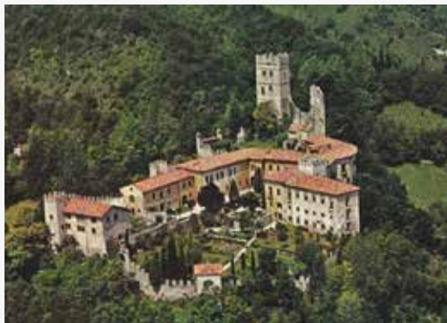
Castello di San Martino VIA BREVIA, 33