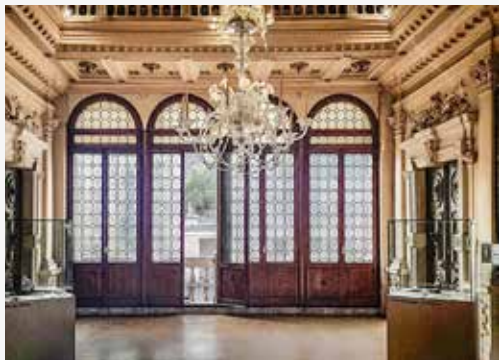
Palazzo Minucci - De Carlo VIA MARTIRI DELLA LIBERTÀ, 35