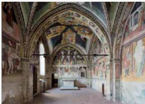
Oratorio dei Battuti Vittorio Veneto PIAZZA TIZIANO VECELLIO