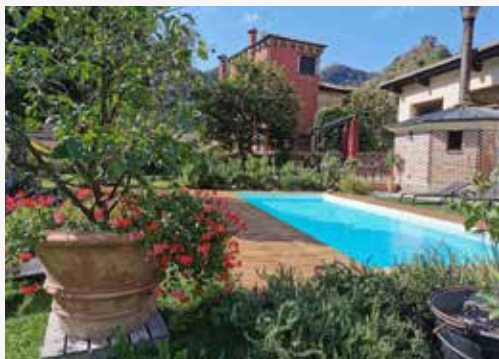
Hotel Calvi - Ristorante Mainor VIA PIER FORTUNATO CALVI, 19